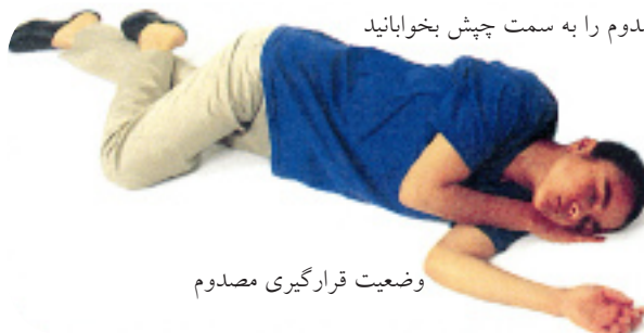
وضعیت قرارگیری مصدوم