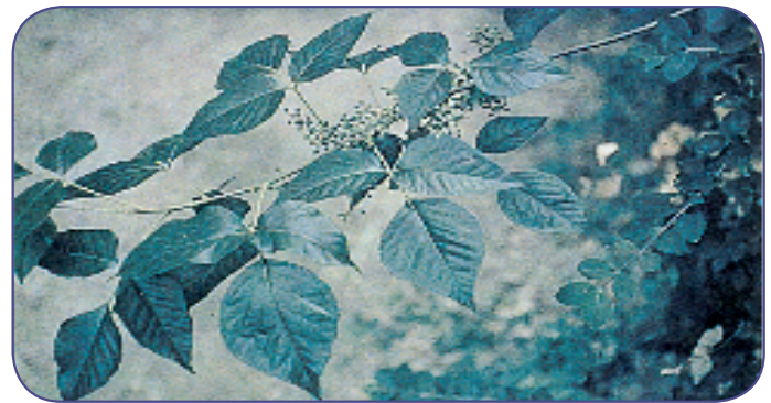
شکل ۳ ب درماتیت پیچک سمی