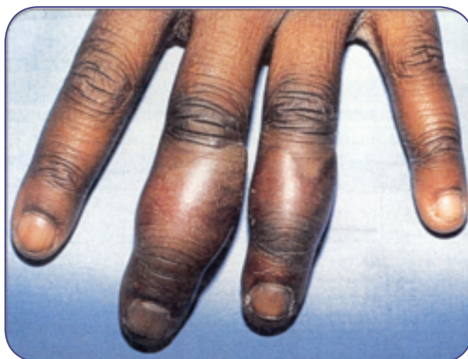
شکل ۱ انگشت سرما زده، ۶ ساعت پس از گرم کردن در آب ۴۰/۵ درجه

علائم و نشانه‌های سرماگزیدگی سطحی عبارتند از: