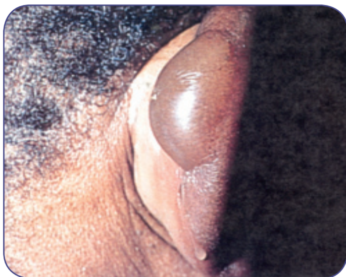
شکل ۳ سرماگزیدگی گوش ۸ ساعت بعد

دسترس دارید، از روش گرم و مرطوب کردن زیر استفاده کنید.