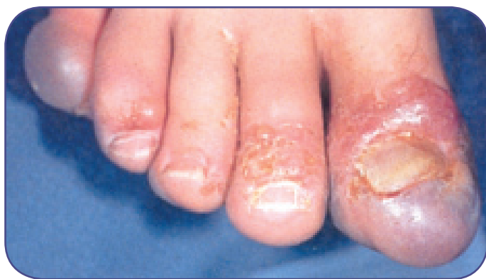
شکل ۲ سرماگزیدگی درجه ۲