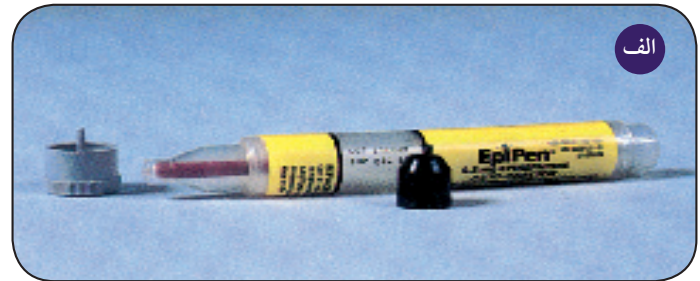
شکل ۱ الف) اتوانژکتور اپی نفرین که توسط پزشک تجویز شده است. ب) اتوانژکتور اپی نفرین با دو فشنگ